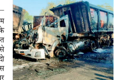
घायल चालक रेफर

अकलतरा-बलौदा मार्ग पर ग्राम कोटगढ़ के समीप रविवार को तड़के तीन ट्रैलर के बीच आपस में जबरदस्त टक्कर हो गई जिसके बाद लगी आग से एक चालक जिंदा जल गया, वहीं दो वाहनों के चालक गंभीर रूप से घायल गए, जिन्हें इलाज के लिए बिलासपुर रेफर किया गया है।