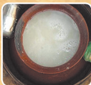
जनजातीय पेय पदार्थ