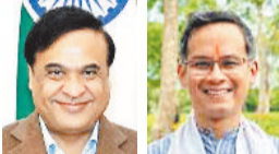
एजेसी ►► दिसपुर

असम विधानसभा चुनाव से पहले राज्य में राजनीतिक टकराव बढ़ गया है। मुख्यमंत्री हिमंता बिस्वा सरमा और कांग्रेस सांसद गौरव गोगोई के बीच पाकिस्तान से जुड़े संबंधों को लेकर एक नई बहस छिड़ गई है। मुख्यमंत्री ने गोगोई के पाकिस्तान दौरे पर गंभीर सवाल उठाए हैं। वहीं, कांग्रेस सांसद गौरव गोगोई ने भी इन आरोपों पर पलटवार किया है। असम के मुख्यमंत्री हिमंता बिस्वा सरमा लगातार उन पर हमले कर रहे हैं। उन्होंने कांग्रेस सांसद पर हमला करते हुए कहा कि ►►शेष पेज 4 पर गौरव का पलटवार पूछ-6 महीने तक चुप क्यों रहे? गौरव गोगोई ने मुख्यमंत्री पर तंज करते हुए कहा कि उन्होंने ढाई घंटे की प्रेस कॉन्फ्रेंस में अपनी एक फ्लाप फिल्म दिखाने की कोशिश की। सीएम अपनी बात कमरे में बैठे प्रकरों को भी नहीं समझ पाए। उन्होंने कहा, मैंने पहले ही कहा था कि यह पत्लाप होगा, लेकिन यह सिर्फ पत्लाप नहीं, बल्कि गुरुर पत्लाप शो साबित हुआ। जो बातें सीएम आज कह रहे हैं, वो 10 सितंबर को भी कह सकते थे, लेकिन वे 6 महीने तक चुप क्यों रहे?