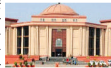
हाईकोर्ट सख्त, कहा मामले की जांच किसी स्वतंत्र जांच एजेंसी को सौंप दी जाएगी

बिलासपुर के सुप्रीम कोर्ट में 165 करोड़ रुपए के संदिग्ध लेनदेन के मामले में छत्तीसगढ़ उच्च न्यायालय ने कड़ा रुख अपनाया है। मामले की सुनवाई करते हुए हाईकोर्ट की डिवीजन बेंच ने यस बैंक को सभी खातेदारों की पूरी जानकारी उपलब्ध कराने का अंतिम अवसर दिया है। न्यायालय ने स्पष्ट किया है कि यदि निर्धारित समय में जानकारी उपलब्ध नहीं कराई गई तो मामले की जांच किसी स्वतंत्र जांच एजेंसी को सौंप दी जाएगी।