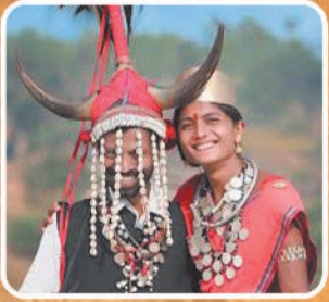
वेशभूषा एवं आभूषण

बस्तर पंडुम से बनी बस्तर की विशिष्ट पहचान